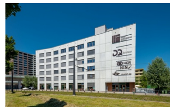
Wallisellen, Seidenstrasse 2-6