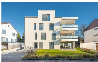
Winterthur, Kreuzeggweg 23