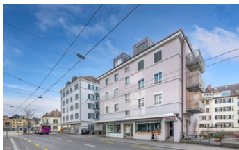
Zürich, Nordstrasse 223