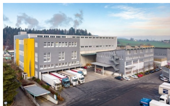
Root, Im Längenbold 7