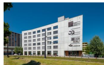
Wallisellen, Seidenstrasse 2-6