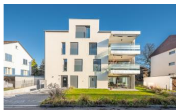
Winterthur, Kreuzeggweg 23