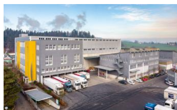
Root, Im Längenbold 7