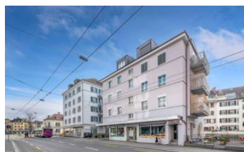
Zürich, Nordstrasse 223